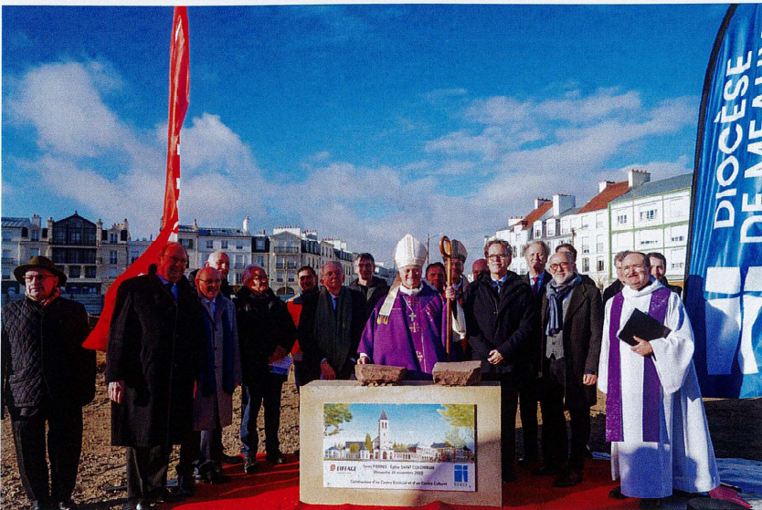
Les personnalités devant les pierres de l'Abbaye de Luxeuil

L'ensemble des formalités nécessaires pour lancer ce projet a pris de longues années pour convaincre puis obtenir l'autorisation du Rectorat de Créteil de créer un collège de 16 classes (500 élèves environ) et un lycée de 9 classes (300 élèves environ). Après avoir obtenu l'accord de principe du Rectorat, il a été nécessaire de reprendre patiemment les négociations avec l'État, Disney et les collectivités locales afin d'obtenir la parcelle de 26 000 m 2 , indispensable à l'installation de l'ensemble des bâtiments scolaires et pastoraux. C'est à la rentrée de septembre 2022 que les premiers élèves ont pu commencer leur scolarité dans des locaux provisoires, soit 2 classes de 6ème et 1 classe de seconde en attendant la construction des locaux définitifs.