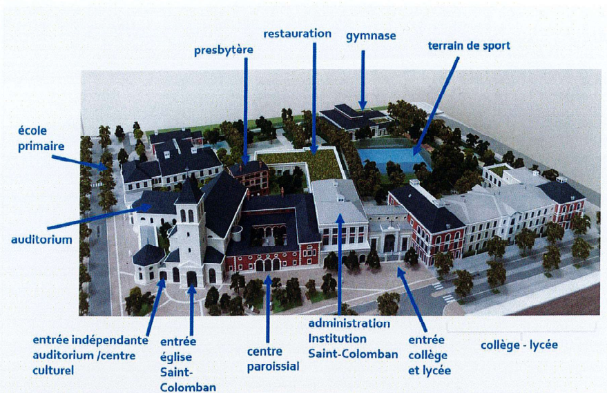
Maquette de l'Espace Saint-Colomban