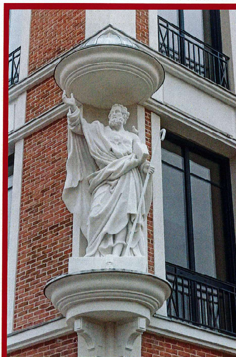
Statue de Saint Colomban