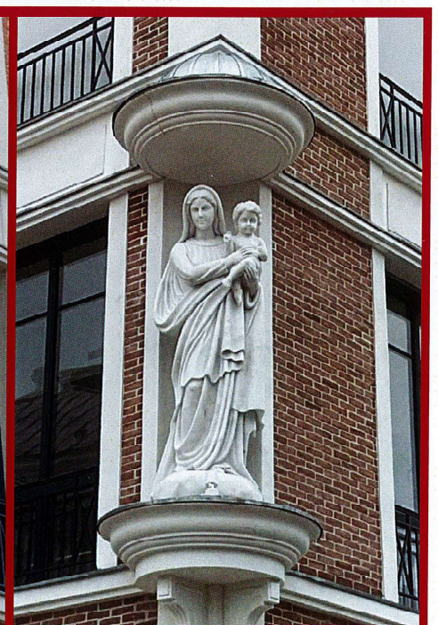
Statue de la vierge