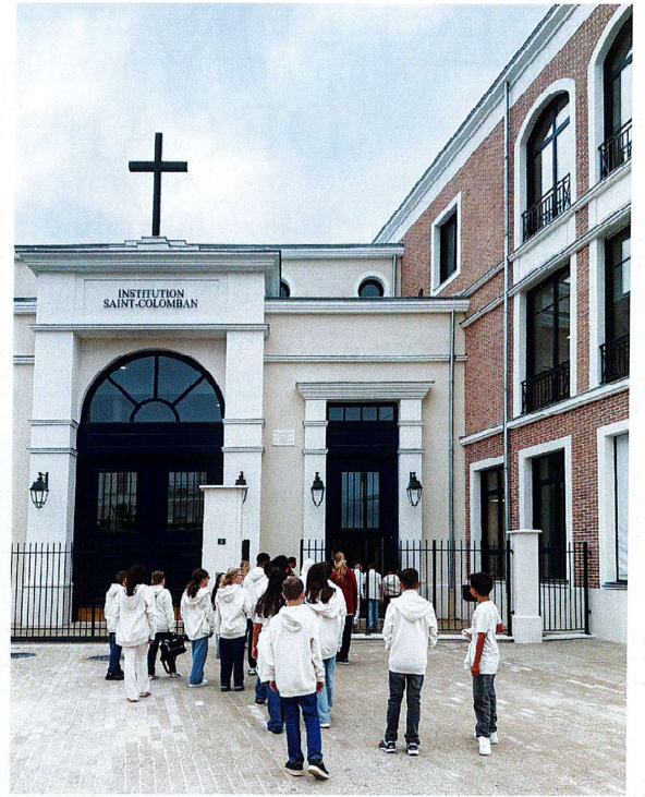
Les élèves avec leur uniforme sur le parvis d'entrée de l'Institution Sains-Colomban

Les espaces de vie (accueil, réfectoire, CIO, salles d'études, chapelle,...) sont spacieux et déjà empreints d'une âme propre à l'établissement, matérialisée par plusieurs symboles : une effigie de Saint Colomban dans le grand hall d'accueil, un olivier arbre de la paix planté ce jour-là, 2 grandes statues en marbre de Carrare : Saint-Colomban à l'angle du boulevard circulaire et de la rue qui dessert l'entrée de l'Institution, une vierge à l'Enfant à l'angle du parvis de l'entrée, et aussi dans les classes un crucifix fixé au-dessus du tableau, les mots-