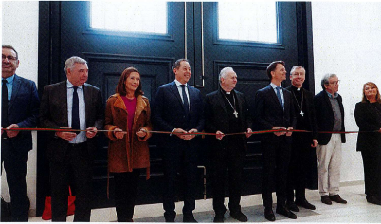
Les personnalités prêtes à couper le ruban d'inauguration

Le projet éducatif proposé aux élèves est articulé autour de notions fortes :