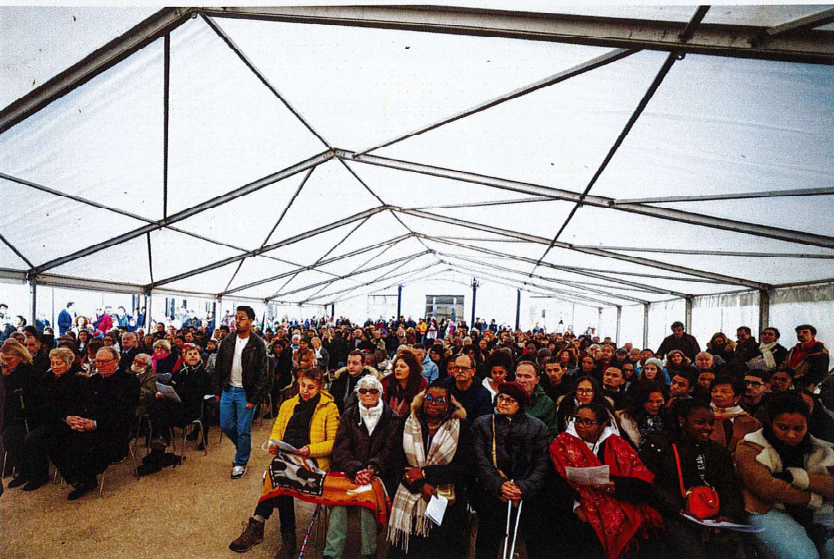
L'assemblée des fidèles de la Paroisse Saint-Colomban

A la rentrée 2025, 360 élèves ont pu s'installer dans les locaux définitifs ; ils seront plus de 900 élèves en 2030, et plus de 1000 à terme avec des classes post-Bac.