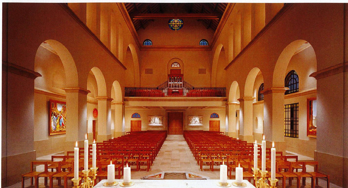
Nef vue du chœur

environnants. Ce sont deux architectes qui sont retenus pour travailler de concert, Pier Carlo Bontempi (de Parme en Italie) pour l'Église et le Centre pastoral et Carole Jenny (de Paris) pour l'établissement scolaire. La nef de l'église Saint Colomban pourra accueillir 600 fidèles et une extension du transept, séparée par une cloison amovible, permettra de recevoir 300 personnes supplémentaires. Juxtaposé à l'église, un centre paroissial sera érigé autour d'un cloître pour accueillir plusieurs salles de réunion destinées à la catéchèse, la formation des adultes et la vie paroissiale, ainsi que des bureaux pour les prêtres et les services administratifs. Ultérieurement, un presbytère sera construit pour loger 4 prêtres et 2 séminaristes. L'extension aura un double usage, d'une part augmenter la capacité de l'église à 900 places lors des grandes célébrations des fêtes religieuses qui ponctuent l'année liturgique (Noël, Pâques, Assomption, Toussaint), mais elle servira