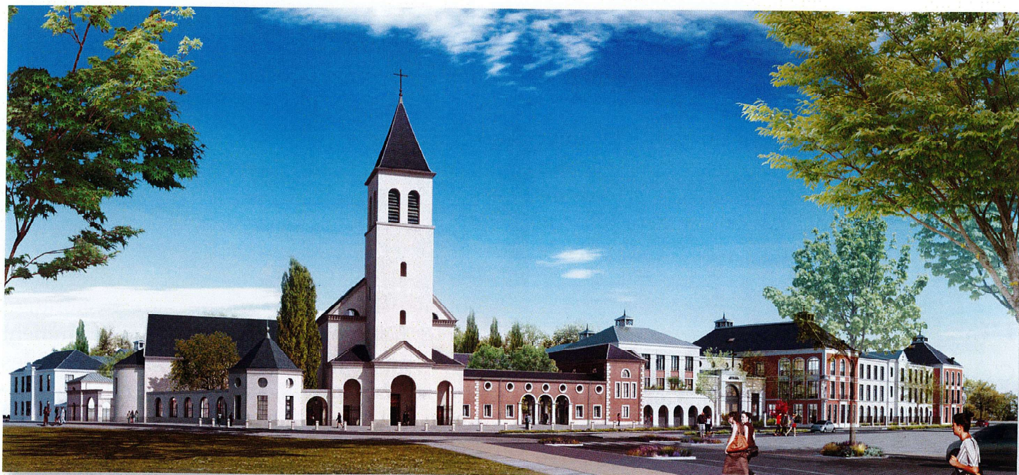
Maquette de Saint Coloman vue de la rue Magellan

également d'auditorium pour les activités de l'Institution Saint Coloman, ainsi que pour les manifestations culturelles organisées par l'Association culturelle Saint Coloman (concerts, conférences, spectacles,...). Afin d'intégrer le transept dans l'église avec élégance, Pier Carlo Bontempi a conçu une petite tour octogonale inspirée des baptistères de la Renaissance italienne. Cette tour, placée au niveau du narthex, est reliée à l'auditorium par une galerie semi-ouverte.